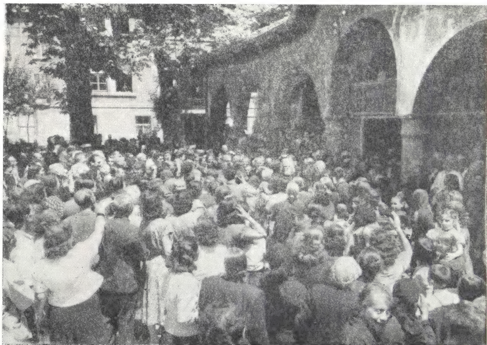
МИТРОПОЛИТА НИКОЛАЯ НА УЛИЦЕ г. ПЛОВДИВА ВСТРЕЧАЕТ НАСЕЛЕНИЕ

В связи с его приездом в Болгарию и мы будем иметь счастье услышать его вдохновенное слово. Своими словами и речами он создаст себе нерукотворный памятник в сердцах миллионов людей».